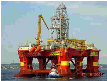
Stena Don.