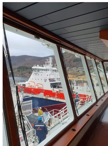
Broen på AKOFS Seafarerer.

med en shaker for å kunne kjøre bore operasjoner. Fartøyet kommer hovedsaklig til å jobbe med intervensjon og ROV operasjoner, så det er ikke sikkert shakeren vil tas i bruk. Men, de kan.